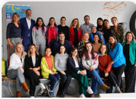
Taal en Kinderop- vang Op Stoom