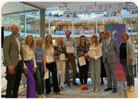
Taal en zorg: UHT